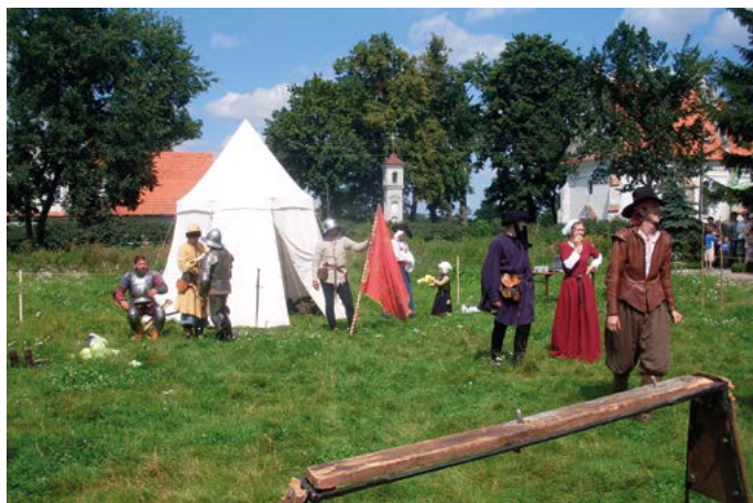
Pokazy chorągwi rycerskiej 2011 rok