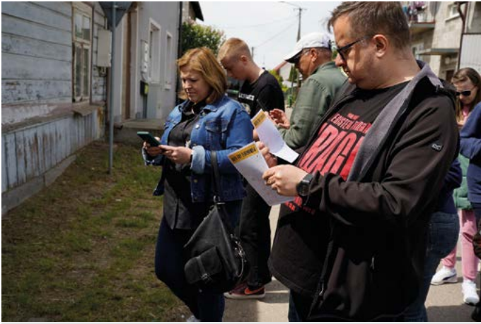
Sobotni spacer „Ścieżkami końskowolskich Żydów” i uczestnicy gry miejskiej