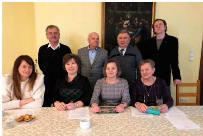
Przedstawiciele obecnego zarządu „Fary” i komisji rewizyjnej

pologiczne szczątków księżnej, dzięki którym wyciągnięto wiele wniosków na temat życia i chorób na dworach ówczesnych możnowładców. Wyniki prac nad materiałem pozyskany w końskowolskich kryptach zostały zebrane w kolejnej naszej publikacji „W źródłach utrwalone – krypty w Końskowoli” autorstwa profesorów, doktorantów i studentów Uniwersytetu Mikołaja Kopernika w Toruniu, wydanej w 2021 roku, przy wsparciu finansowym Gminy Końskowola.