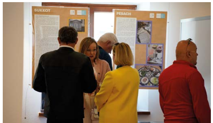
Zwiedzanie wystawy „Symbolika w kulturze żydowskiej”

Podczas tych trzech dni w Ratuszu można było otrzymać – z okazji wizyty „Muzeum Na Kółkach” - nieodpłatnie „Kajet końskowolski nr. 8 - Żydzi końskowolscy cz. 1”. Zawiera on między innymi ogólne informacje z historii Żydów w Polsce, zasady funkcjonowania żydowskiego miasteczka – sztetla oraz artykuły dotyczące życia Żydówki, zarządczyni klucza końskowolskiego za czasów Elżbiety Sieniawskiej oraz artykuł o życiu Julii Pirotte, znanej fotografki i fotoreporterki, która urodziła się w Końskowoli. Pula bezpłatnych 100 egzemplarzy „Kajetu” szybko się