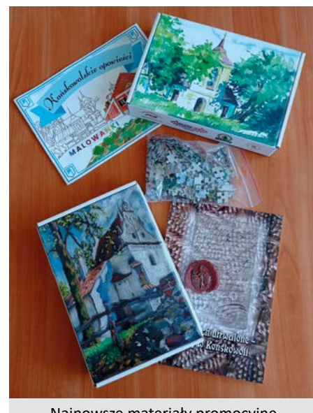
Najnowsze materiały promocyjne i wydawnictwa stowarzyszenia