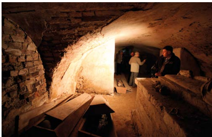
Otwarcie krypt w czasie remontu kościoła farnego lata 2009-2011

Kiedy Rada Gminy w 2020 roku podjęła decyzję o wszczęciu postępowania mającego na celu przywrócenie statusu miasta Końskowoli, Zarząd TODK „Fara Końskowolska” aktywnie włączył się w upowszechnienie tej idei. Po wielu zawirowaniach na koniec marca 2024 roku