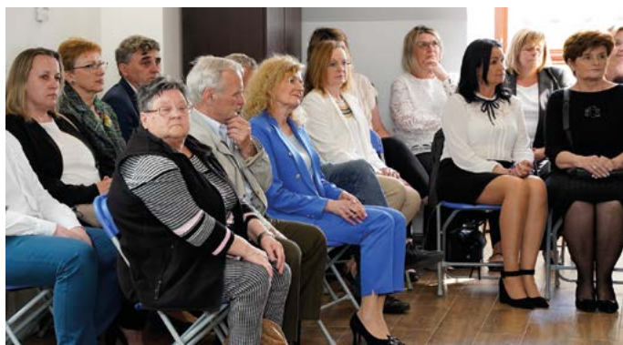
Mieszkańcy i pracownicy gminnych instytucji