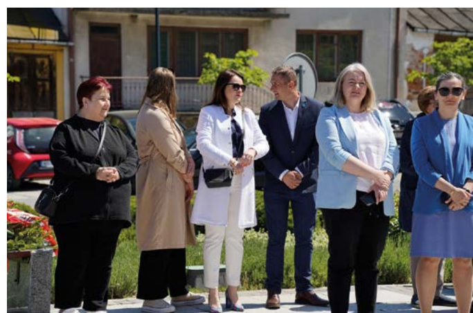
Radni Gminy Końskowola podczas uroczystości