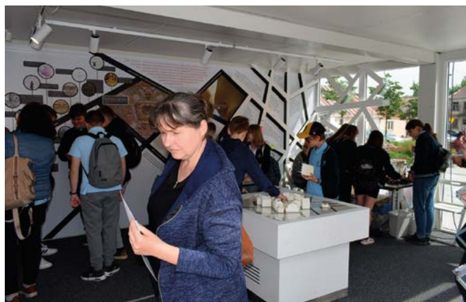
Wnętrze pawilonu wystawowego „Muzeum na kółkach”