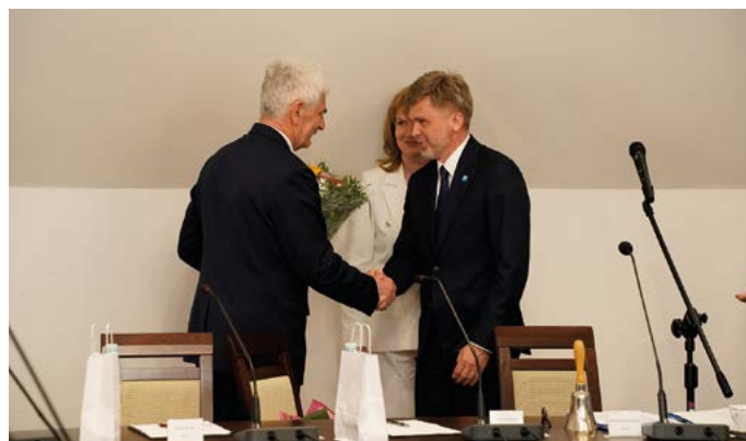
Wzajemne podziękowanie i gratulacje na najwyższym szczeblu gminy

Szanowni państwo chciałem przypomnieć jak gmina wyglądała 32 lata temu: drogi, wodociągi kanalizacja i szkoły, które przejęliśmy w 1996 roku.