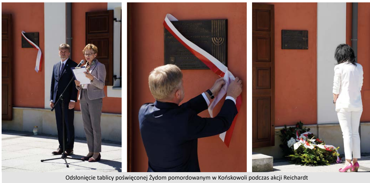
Odśnięcie tablicy poświęconej Żydom pomordowanym w Końskowoli podczas akcji Reichardt

wyczerpała, ale dla miłośników historii Końskowoli robimy dodruk i odpłatne egzemplarze będą wkrótce dostępne w sprzedaży w bibliotece w GOK.