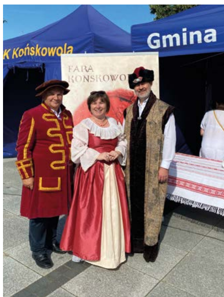
Stoisko „Fary” podczas Święta Róż w 2023 roku

W 2020 roku z naszej inicjatywy rozpoczęły się prace konserwatorskie nad XIX-to wiecznym feretronem z dwoma obrazami oraz nad wizerunkiem Matki Boskiej Czytającej. W trakcie usuwania zanieczyszczeń i przemalowań okazało się, że obrazy są dużo starsze, niż wynikało to z karty zabytku. Dwa przedstawienia Matki Boskiej pochodzą z pierwszej ćwierci XVII wieku, a obrazy z feretronu zostały tam umieszczone po wcześniejszym przycięciu. Dzięki ogromnej pracy, doświadczeniu, wytrwałości i cier-