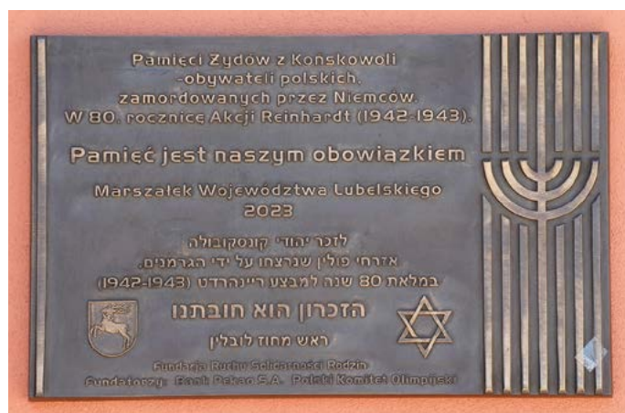
Pamiętkowa tablica umieszczona na wschodniej ścianie Ratusza