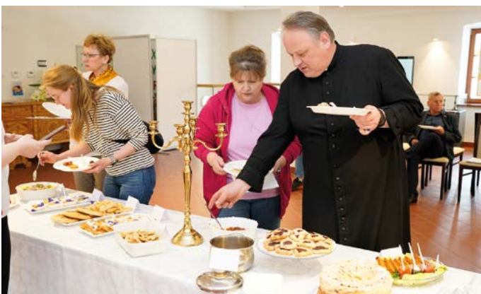
Finał Konkursu Kulinarnego Dań Inspirowanych Kuchnią Żydowską - Jury konkursowe w trakcie degustacji