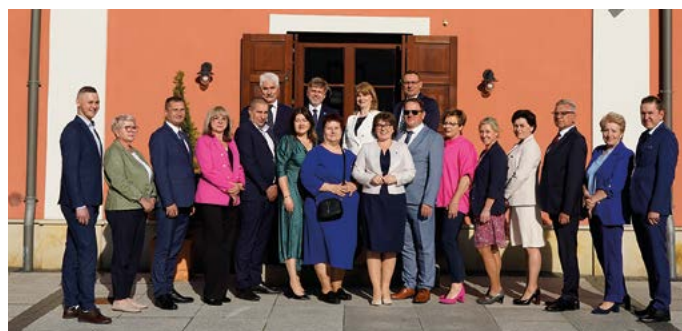
Rada Gminy Końskowola IX kadencji

Zapis sesji dostępny jest na stronie Urzędu Gminy.