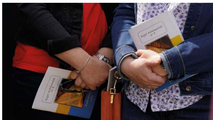
„Kajet Końskowolski nr 8 - Żydzi Końskowoli cz. 1”

Na Rynku w Końskowoli w dniach 10-12 maja 2024 r. gościliśmy „Muzeum na kółkach”, mobilną wystawę zorganizowaną przez Muzeum Historii Żydów Polskich POLIN w Warszawie. W pawilonie wystawowym można było ogólnie zapoznać się ze zbiorami Muzeum POLIN, jego działalnością oraz poznać fragmenty historii polskich Żydów. Niewątpliwą atrakcją wystawy były kopie przedmiotów związanych z żydowską kulturą, a także wirtualna mapa Końskowoli z zaznaczonymi miejscami, które wiążą się z końskowolskimi Żydami. Podczas trzydniowego pobytu Muzeum w Końskowoli wiele się działo.