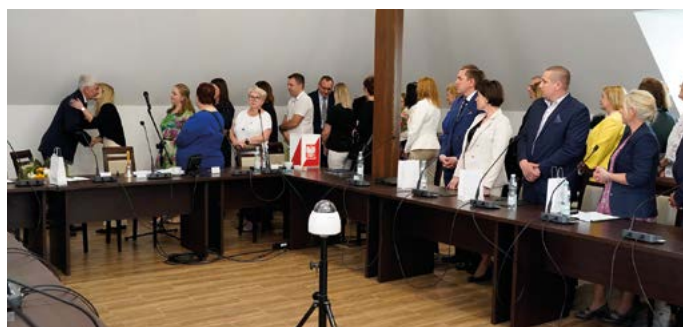
Podziękowanie i wyrazy wdzięczności dla ustępującego Wójta od społeczności naszej Gminy

To nie wynikało z preferowania jednej czy drugiej wsi. Zawsze proponowałem do realizacji takie inwestycje, na które aktualnie można było pozyskać środki zewnątrz. Nie na wszystko w jednakowym czasie te pieniądze się zjawiały, więc niektóre przedsięwzięcia oddalały się w czasie. Muszę jeszcze wspomnieć o jednym chamstwie, jakie spotkało mnie na obradach Wysokiej Rady: „Do brzegu panie wójcie, do brzegu...”. Pan Przewodniczący próbował prze-