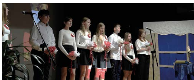
Uczniowie ze Szkoły Podstawowej w Końskowoli

Jak co roku uroczyste obchody rocznicy uchwalenia pierwszej konstytucji w historii naszego kraju rozpoczęła msza święta w kościele parafialnym. Po modlitwie mieszkańcy naszej gminy przemaszewali ulicą Lubelską na dalsze uroczystości do Gminnego Ośrodka Kultury w Końskowoli im. K. Walczak.