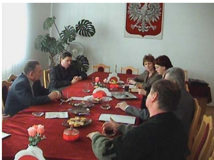
Pierwsze walne zebrania - luty 2005 r.

W październiku bieżącego roku będziemy obchodzić 20 rocznicę powstania Towarzystwa Ochrony Dziedzictwa Kulturowego „Fara Końskowolska”. Podstawowymi celami powoływanego stowarzyszenia były: 1) ochrona i odnowa zabytkowego zespołu Kościoła Parafialnego i innych obiektów, które stanowią integralny element dziedzictwa kulturowego Końskowoli; 2) dążenie do zapewnienia wysokiego poziomu rozwoju moralnego, społecznego i kulturalnego członków społeczności lokalnej; 3) upowszechnianie wśród młodzieży idei zaangażowania w życie społeczne, narodowe i chrześcijańskie; 4) integracja środowiska lokalnego; 5) wspieranie inicjatyw społecznych.