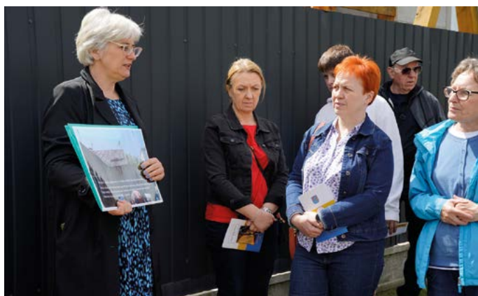
Sobotni spacer „Ścieżkami końskowolskich Żydów”