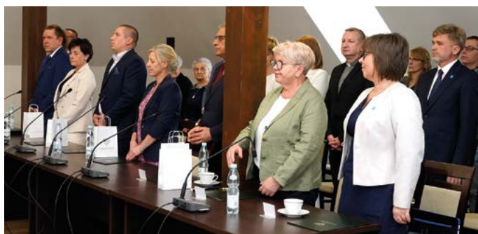
Moment składania ślubowania przez radnych i Wójta