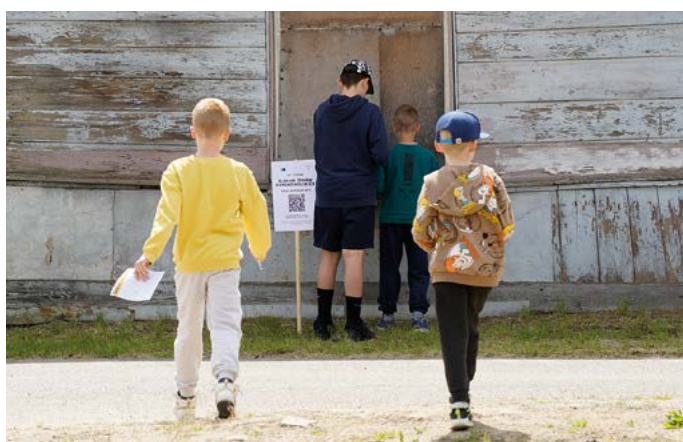
Uczestnicy gry miejskiej