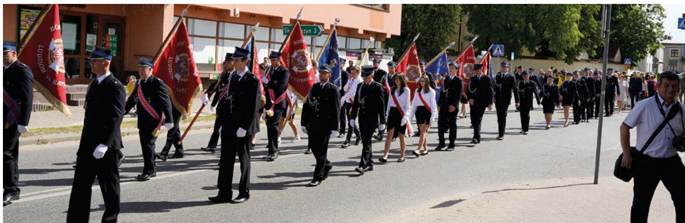
Uroczysty przemarsz uczestników uroczystości do GOK w Końskowoli