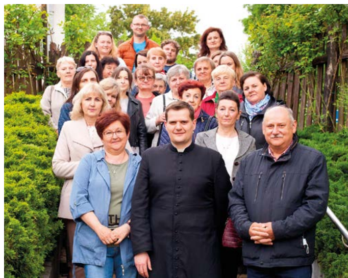
Wspólnota „Przyjaciele Oblubieńca” z Końskowoli

Seminarium poprzedziła jeszcze niedziela ewangelizacyjna. Po każdej Mszy Świętej można było usłyszeć świa-