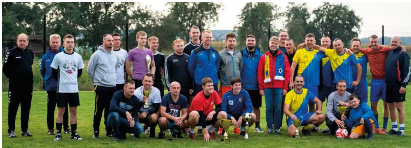
Drużyny Piłkarskie, które zajęły pierwsze trzy miejsca: 1. „Młynki”, 2. „KTS Końskowola” i 3. „Wronów”