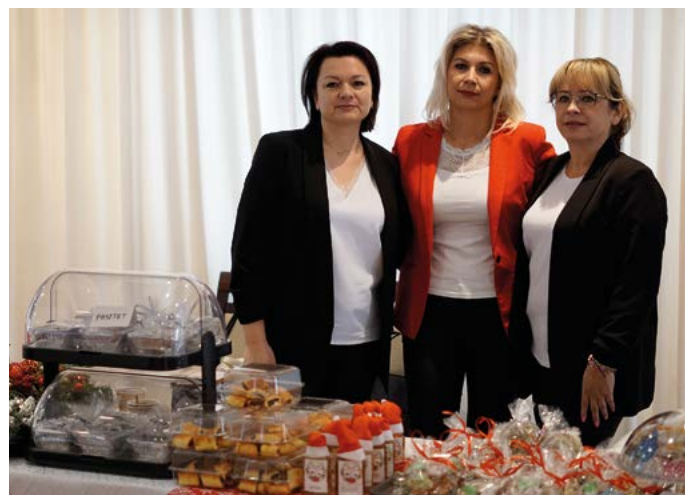
Panie z Wronowa otrzymały najwięcej nagród