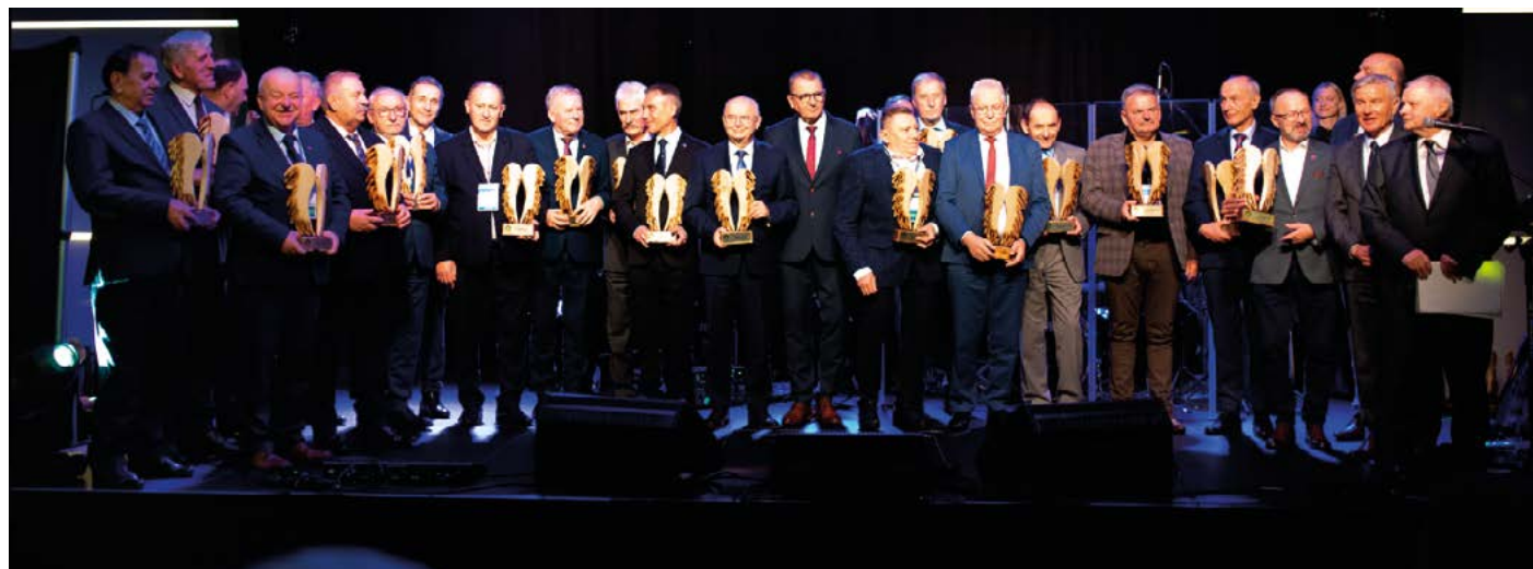
„Orły Samorządności” dla 28 ośmiokadencyjnych wójtów i burmistrzów z całej Polski