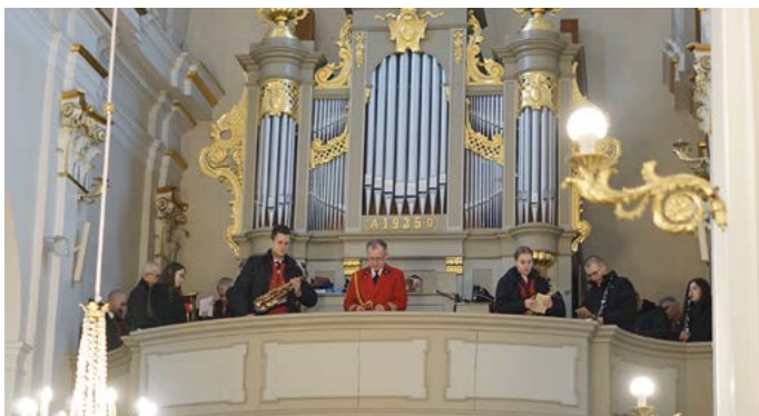
Oprawa mszy świętej w wykonaniu Gminnej Orkiestry Dętej