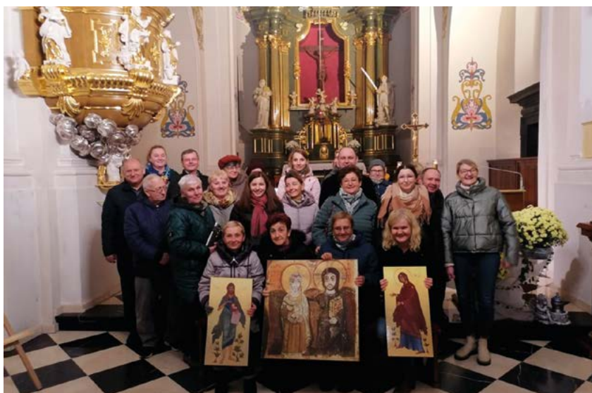
Wspólnota „Przyjaciele Oblubieńca” w Końskowoli