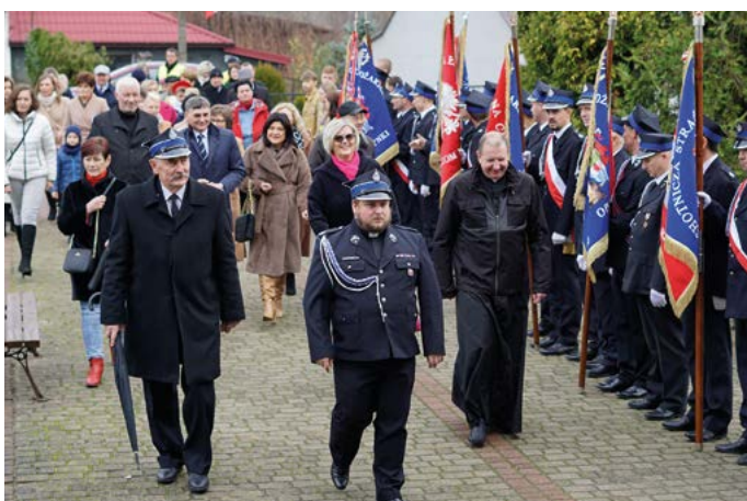
Przemarsz uczestników uroczystości z kościoła do Gminnego Ośrodka Kultury