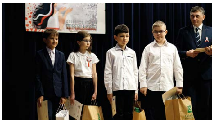
Laureaci XIII konkursu „Zabytki Końskowoli i ich historia”