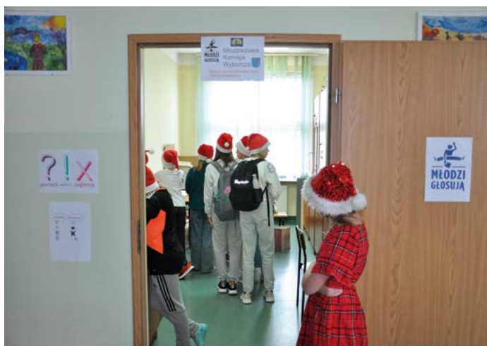
Głosowanie w S.P. w Końskowoli