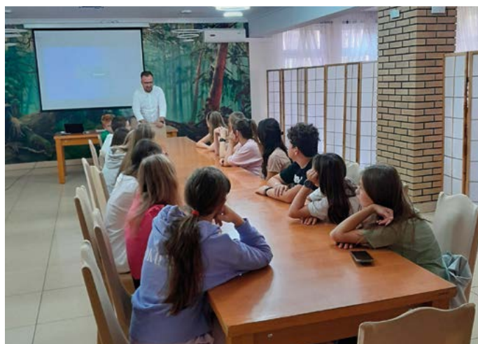
Szkolenie na wyjeździe integracyjnym