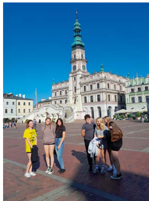
Kandydaci do Młodzieżowej Rady Gminy Końskowola

6 grudnia w Szkole Podstawowej w Końskowoli odbyły się pierwsze wybory do Młodzieżowej Rady Gminy Końskowola. Nad ich przebiegiem czuwała specjalna komisja, w skład której weszły uczennice klas VII i VIII oraz opiekun Szkolnego Samorządu. Wyniki głosowania i skład pierwszej MRG Końskowola opublikowane zostaną w styczniowym numerze Echa Końskowoli.