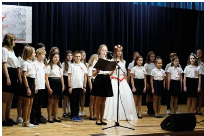
Spektakl przygotowany przez uczniów klas 4-8 z Zespołu Placówek Oświatowych w Pożogu

z klasy III a S.P. Końskowola wykazujący szczególne zainteresowanie historią regionu.