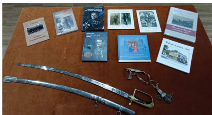
Kilka publikacji Zbigniewa Kielba i szabla paradna jednego z oficerów zamordowanych w Zbrodni Katyńskiej