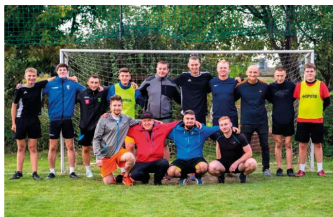
Zwycięska drużyna „Wronów”